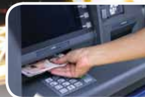
Retail and Banking