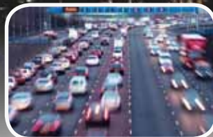
Intelligent Traffic Systems